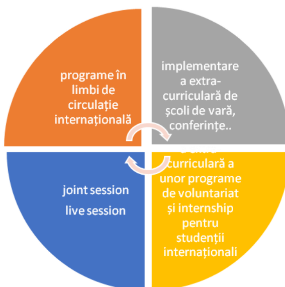
Fig. 4 Internaționalizarea curriculară a ofertei educaționale a Facultății de Științe Sociale